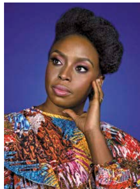
▲ Chimamanda Ngozi Adichie.

“Trecento invitati. Non è una sciocchezza!”, disse mia madre. Le sue parole erano stratificate, dense di complimenti inespresi: che moglie devota era zia Chinwe, com'era straordinario che spendesse i suoi soldi per quella festa, com'era magnifico che ce li avesse quei soldi, tanto per cominciare. Zia Chinwe neutralizzò l'ammirazione di mia madre con la naturalezza di una persona abituata ai