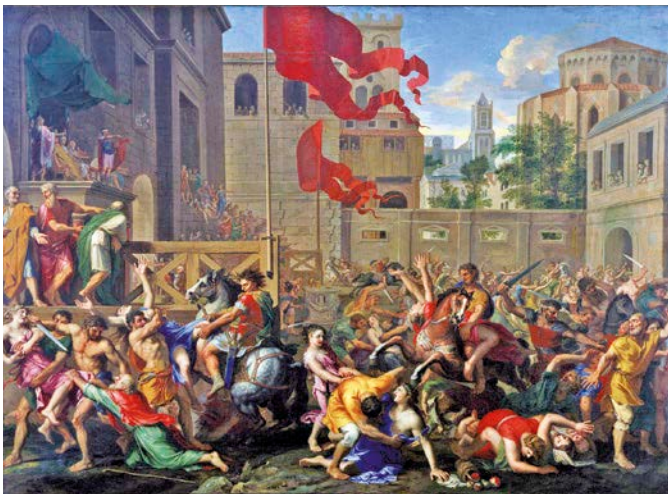
◀ Jacques Stella, Il ratto delle Sabine , metà XVII secolo, Princeton University Art Museum, Princeton.