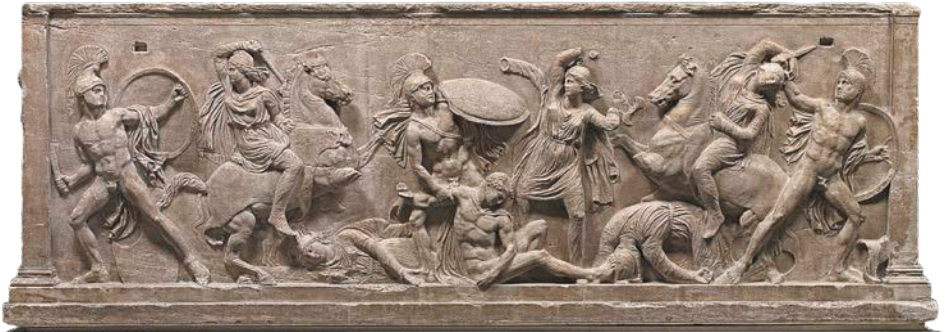
▲ Battaglia tra Greci e Amazzoni, da un sarcofago greco in marmo, 350-300 a.C., Kunsthistorisches Museum, Vienna.