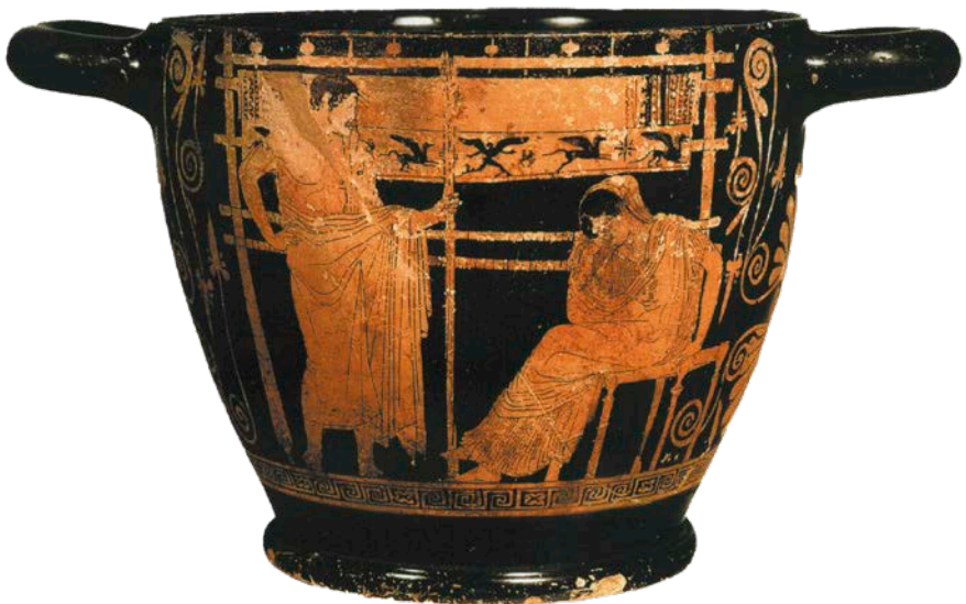
▲ Penelope al telaio con il figlio Telemaco in uno skyphos attico a figure rosse attribuito al Pittore di Penelope, da Chiusi, 440-435 a.C., British Museum, Londra.