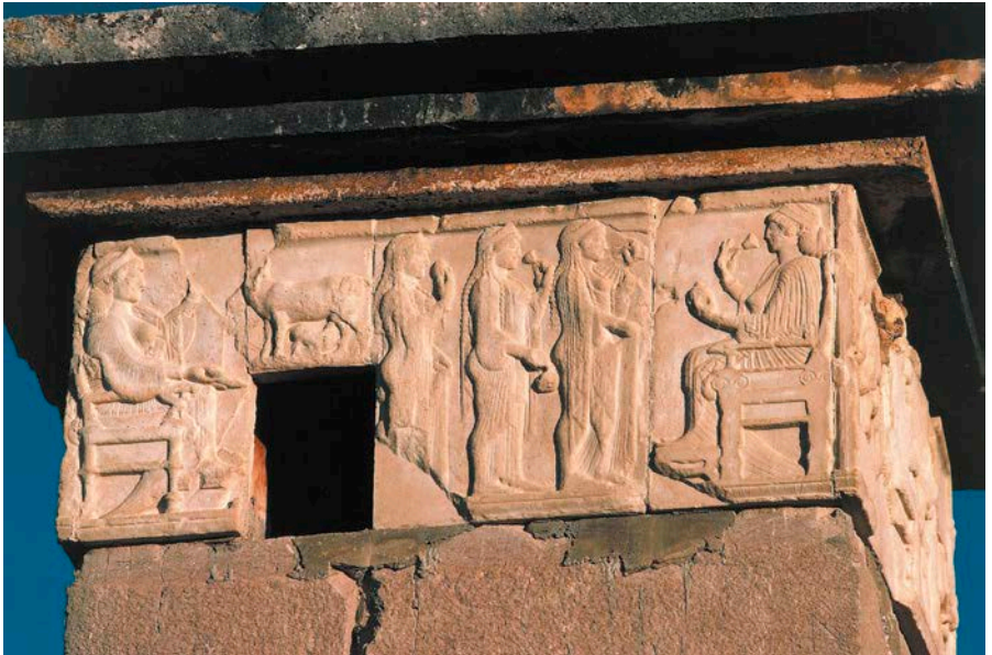
▲ Pannello del lato ovest dalla cosiddetta “tomba delle Sirene”, dalla necropoli di Xanthos in Licia, VI-IV secolo a.C., British Museum, Londra.