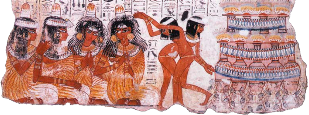
▲ Particolare di affresco dalla tomba di Nebamun raffigurante una scena di banchetto con musiciste e danzatrici, da Tebe, 1350 a.C. ca., British Museum, Londra.