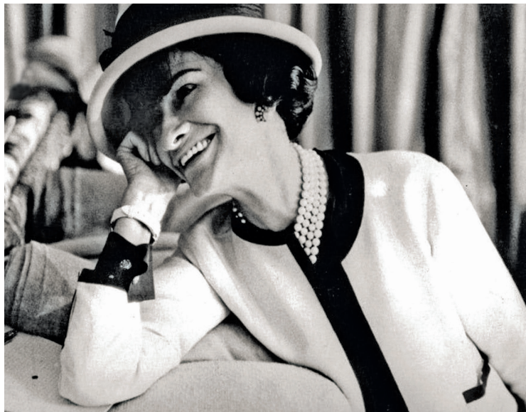
↑ Mademoiselle Chanel nel 1962.

Era una sarta anche Rosa McCauley , nata nel 1913 nello stato dell'Alabama; nel 1932 sposa Raymond Parks (attivo nel movimento dei diritti civili) e comincia a svolgere il lavoro di sarta in un grande magazzino di Montgomery. Dal 1943 entra a far parte del National Association for the Advancement of Colored People diventandone segretaria. Intorno al 1955 (nello stesso periodo in cui Martin Luther King lotta per i diritti dei neri) inizia a frequentare un centro educativo per i diritti dei lavoratori e l'uguaglianza razziale. Il 1° dicembre di quell'anno le accade un episodio che le cambia la vita: Rosa sta tornando a casa in autobus dal suo lavoro di sarta; nella vettura, non trovando altri posti liberi, occupa il primo posto dietro alla fila riservata ai soli bianchi, nel settore dei posti comuni. Dopo tre fermate, l'autista le chiede di alzarsi e spostarsi in fondo all'automezzo per cedere il posto ad un passeggero bianco salito dopo di lei. Rosa, mantenendo un atteggiamento calmo, sommo e dignitoso, rifiuta di muoversi e di lasciare il suo posto. Il conducente ferma così il veicolo e chiama due agenti di polizia per risolvere la questione: Rosa Parks viene arrestata e incarcerata per condotta impropria e per aver violato le norme cittadine che obbligano le persone di colore a cedere il proprio posto ai bianchi nel settore a loro riservato. Ne segue il boicottaggio degli autobus da parte della