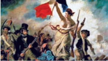
Donne durante la Rivoluzione francese