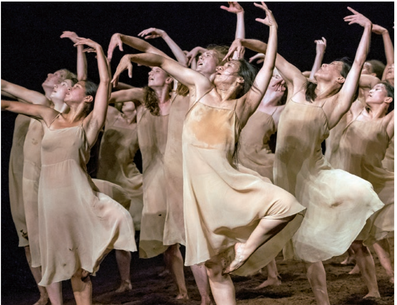
↑ La Compagnia Pina Bausch interpreta Café Müller .

lavoratrice al ristorante: assieme ad altri cinque interpreti, su musica di Henry Purcell, vi inserisce la parola e il suono di oggetti quotidiani, con i quali esprime tenui emozioni, quali il ridere e il piangere ma anche urlare, sussurrare, tossire o piagnucolare, totalmente estranei al mondo della danza e dunque di grande impatto e rottura. Con lo spettacolo Ein Stück von Pina Bausch (1980), Pina Bausch porta a compimento il suo linguaggio neo-espressionista, dove il ballerino è una persona che veste abiti quotidiani e compie gesti normali; questo suscita ancora scandalo fra i difensori del balletto tradizionale che l'accusano di volgarità e cattivo gusto, di eccesso di realtà. Ma la coreografa rimane legata alle proprie idee, con le quali rompe definitivamente gli schemi di una concezione coreutica legata al “balletto” che fino ad allora non aveva dato sufficiente risalto al gesto, all'espressività, alla “teatralità”.