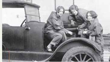
Donne tra famiglia e lavoro