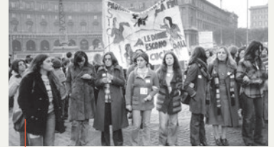
Donne e uguaglianza civile

La Rivoluzione francese (1789) porta in primo piano i diritti di uguaglianza e di libertà alla cui rivendicazione partecipano anche le donne. Ma la stagione di libertà vissuta dalle donne nel periodo rivoluzionario dura poco, perché le norme del Codice Civile napoleonico del 1804 riportano la donna alla situazione di dipendenza precedente la Rivoluzione. Il Codice riduce i diritti civili della donna e la considera debole, fisicamente e intellettualmente, bisognosa di un tutore (prima il padre, poi il marito). Alle donne, d'altronde, durante la Rivoluzione francese non sono riconosciuti i diritti politici e civili, pertanto esse non possono rivendicare nulla, perché non sono considerate soggetti autonomi, cittadine a pieno titolo bensì semplicemente membri del "gruppo famiglia" i cui interessi sono "naturalmente" coincidenti con quelli delle donne. Ma l'esperienza della Rivoluzione, anche se limitata nel tempo, non passerà senza conseguenze, come tutti i fatti storici.