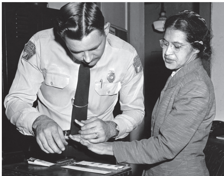
↑ Rosa Parks nel comando di polizia in seguito all'arresto del 1° dicembre 1955.

popolazione nera che mette in crisi tutta la rete di trasporti pubblici locali. Rosa viene processata ma la Corte Suprema conclude che «la segregazione dei neri sui pullman dell'Alabama è incostituzionale». Per quel gesto Rosa Parks viene ricordata come "la madre del movimento per i diritti civili", insignita di una onorificenza nel 1999.